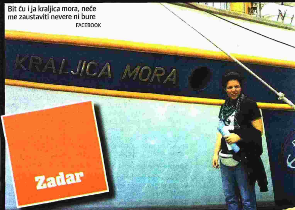
Bit ću i ja kraljica mora, neće me zaustaviti nevere ni bure FACEBOOK