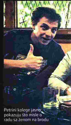
Petrini kolege jasno pokazuju što misle o radu sa ženom na brodu